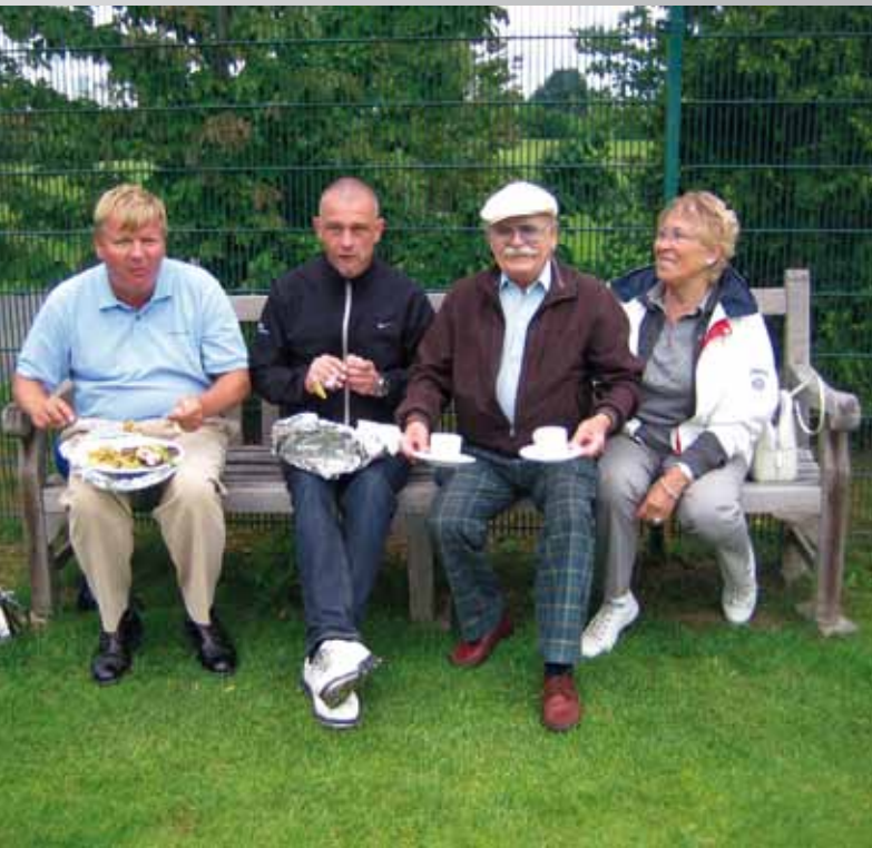
Auch die Zuschauer wurden bestens versorgt.