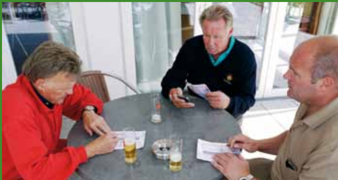
Auswertung der Ergebnisse.