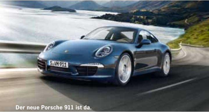
Der neue Porsche 911 ist da.